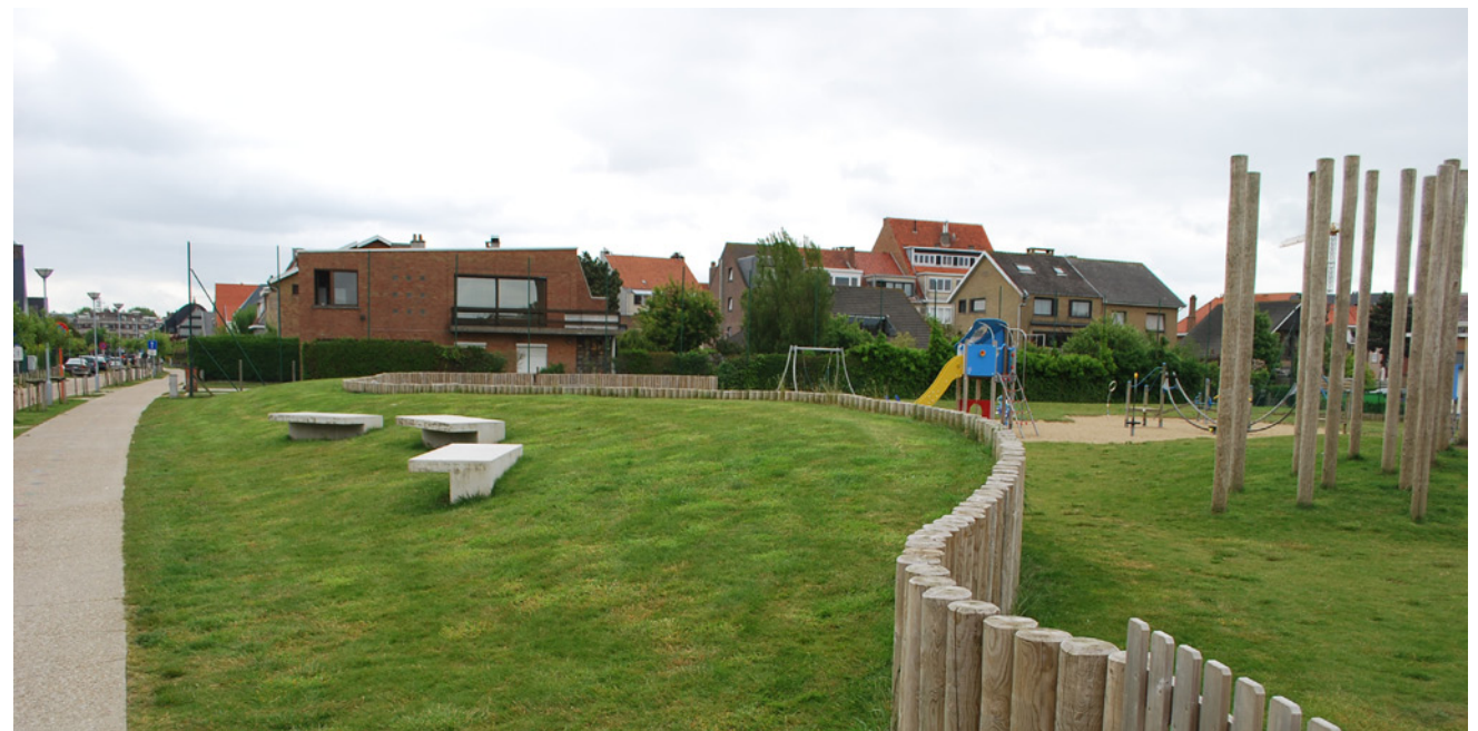
Foto boven: Bestaande toestand voorheen: Het speelterrein had een gesloten structuur.

Een hekje en afsluiting scheidden de speelruimte van haar omgeving.