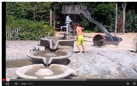
Avontuurlijke speekansen in Vrijbroekpark Mechelen Kind & Samenleving vzw · 1 video · 18 weergaver Leuk · Over · Delen · Toevoegen aan