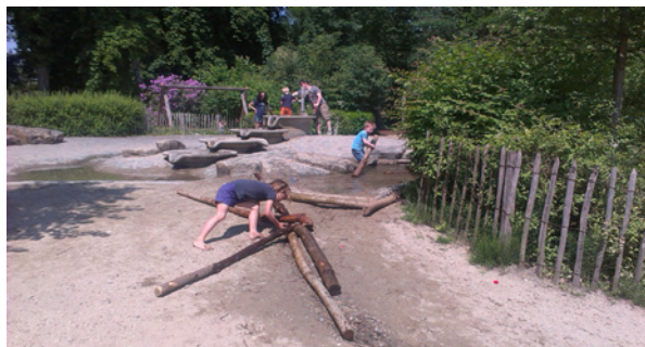
Foto boven: Kinderen vissen de stokken weer op die aan de kant zijn gelegd

Foto onder: De stokken worden ingezet als dammen en constructies