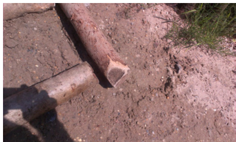
Foto boven: Takkenwal naast de speelruimte. Foto onder: Stokken met afgeronde punt. Onder : filmpje op you tube.