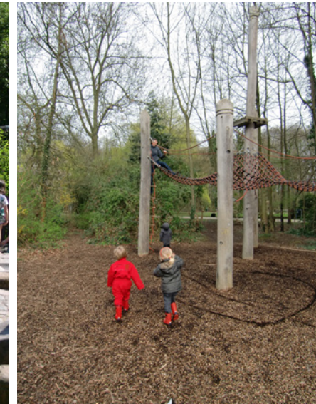
Foto links : De waterspeelplaats als hart van de speelruimte Foto rechts : De speelruimte vervloeit in de aanliggende bosjes

Kristel Ketels, de verantwoordelijke voor het Provinciaal Groendomein Vrijbroek: "De stokken zijn afkomstig van houtstapels die de voorbije winter zijn geplaatst in het rechterbosje naast de speeltuin. Die houtstapels