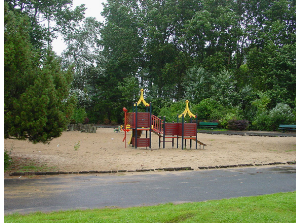
Foto's boven; voor de herinrichting Foto's onder; na de herinrichting