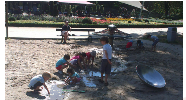
Foto boven : De waterzone breidt spontaan uit Foto onder : Een gezamenlijk doel: de bank van grote mensen in het water zetten