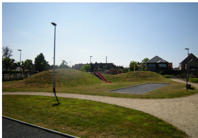
Foto's: Speelheuvel en petanqueveldjes, buurtterrein Balen-Neetlaan

“Projecten vallen minder snel in het water, zelfs als één verantwoorde-lijke van job of focus verandert.”