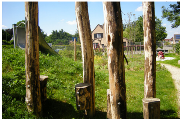
Foto's Herent: Insectenwand en pas angeplante vlindertuin en Balken op speelterrein Binnenhof.